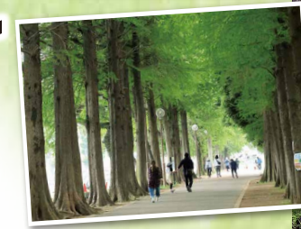
▲沼の周りは散歩に最適。