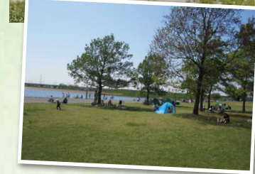
▲レジャーシートを広げてのんびりと1日を楽しめます。

彩湖周辺の広大な水辺空間を有効的に活用しようと作られた公園です。「カマキリ公園」の愛称で親しまれるこの公園では、美しい緑に囲まれながらスポーツやレクリエーションができるほか、子どもたちに大人気の遊具もあります。