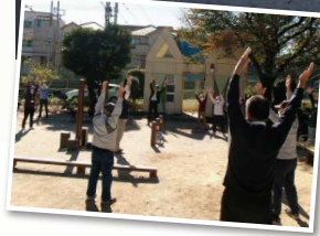
▲すこやか運動教室の様子。

神明丸公園では、子どもの遊び場だけでなく、高齢者の健康づくりとして「すこやか運動教室」を開催しており、30回参加された方は表彰を受けられます。*すこやか運動教室の開催場所や日程は、「市報さいたま」南区版でご確認ください。